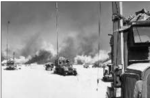
Aus einem Armee-Werbeprospekt

sentliche Rolle im Hintergrund des Oppositionstreffens in London. Seine Aufgaben liegen mehr im operationellen Bereich. Konzeptionell hat das einflussreiche `Deputies Committee` die Federführung übernommen. Die `Vizes` aus State Department, Pentagon, der Generalität, dem Nationalen Sicherheitsrat sowie dem Büro des Vizepräsidenten treffen sich regelmäßig im `Lageraum` des Weißen Hauses und arbeiten seit dem Herbst an einem Nachkriegsplan für das Zweistromland. Eine weitere Arbeitsgruppe im State Department, das bereits 1999 ge-