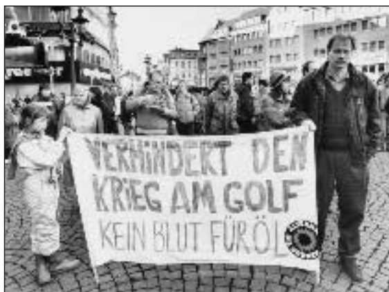
Demonstration in Bonn, 24.11.90: Stoppt den Krieg am Golf

über die Türkei, den Hafen Ceyhan, vielleicht auch über einen sich dem Westen zuneigenden Staat Syrien. Diese Pipelines sind vorhanden. Ich bin sicher, die Amerikaner träumen noch einen anderen Traum: Irakisches Öl soll eines Tages über Haifa in den Westen transportiert werden. ... Sechs Millionen Barrel pro Tag aus dem von US-Kriegsschiffen geschützten Mittelmeer zu transportieren, das ist durchaus möglich. Und das bedeutet dann für die USA energiepolitische