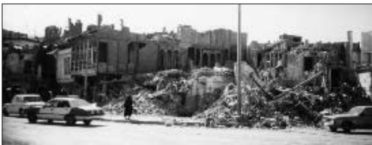
Kerbala (Irak) nach dem 2. Golfkrieg und dem Schiiten-Aufstand 1991

Das Verhalten Tony Blairs und George W. Bushs erinnert an eine Neuauflage der Kolonialpolitik vor rund einhundert Jahren.