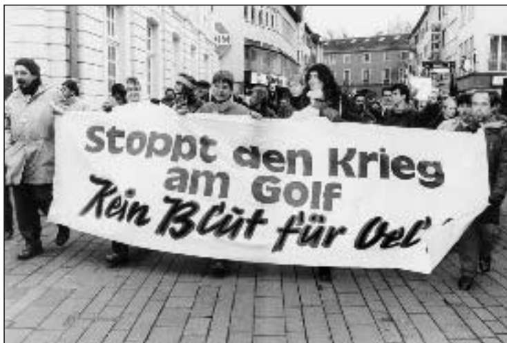
Motto auf der Demonstration in Bonn am 24.11.1990

An vielen US-Militärstützpunkten fanden bereits Demonstrationen statt, an einigen auch Sitzblockaden (Rhein-Main-Airbase/Frankfurt, EUCOM/Stuttgart). Neben Stuttgart Vaihingen, Ramstein, Rhein-Main Airbase Frankfurt, Spangdahlem, Heidelberg, Wiesbaden, Kaiserslautern, Würzburg, Grafenwöhr, Mannheim und Böblingen, wo jeweils US-Soldaten stationiert sind, die mit in