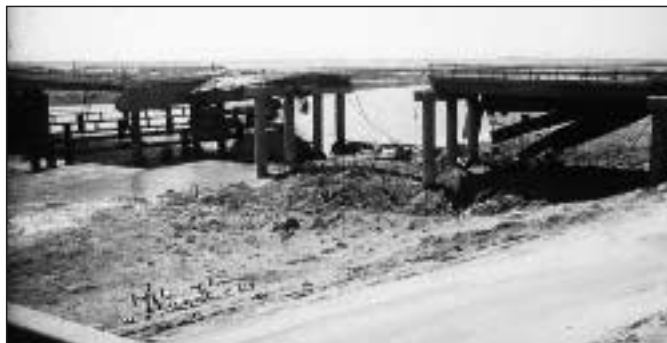
Tigrisbrücke nach dem 2. Golfkrieg und dem Schiiten-Aufstand 1991

3. Ölmultis als eigenständiger Spieler: Zwar sind die großen Ölfirmen, historisch gesehen, Produkte aus der Zeit des Imperialismus' und bis zum Zweiten Weltkrieg auch als machtpolitische Instrumente für nationalstaatliche Interessen eingesetzt worden. Doch die Globalisierung hat die Spielregeln grundsätzlich verändert. Ölmultis sind wirklich multinationale Unternehmen, deren Hauptaufgabe es ist, Geld zu verdienen, um ihre Aktionäre (Shareholders) zufriedenzustellen. Dies können sie besser durch ihre internationale Verflechtung, als wenn sie an der Leine nationaler Regierungen agieren. Zwar legen sie Wert darauf, dass Staaten günstige Rahmenbedingungen schaffen (Sicherheit, verlässliche Rechtsordnung, niedrige Steuern und Zölle etc.), aber ihre Geschäftspartner suchen sie nach nicht-nationalen Kriterien aus. Deshalb drängen amerikanische Firmen nicht mehr als andere darauf, im Irak eine klare Geschäftsgrundlage zu schaffen. Möglicherweise drängen sie überhaupt nicht darauf, weil die Erschließung des Irak angesichts eines durchaus gesättigten Weltmarktes in der Tendenz den Ölpreis senkt und damit andere Engagements weniger rentabel macht. Es kann nicht im Interesse der USA liegen, die seit drei Jahren bestehende preisstabilisierende Politik der OPEC zu untergraben.