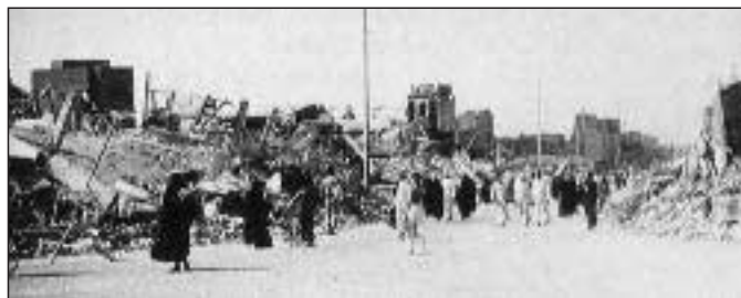
Kerbala (Irak) nach dem 2. Golfkrieg und dem Schiiten-Aufstand 1991

„Mit Awacs auf politischem Blindflug über Absurdistan“ lautete die Überschrift in der FR, 13.12.02: „Awacs-Flugzeuge, sagt der Kanzler, seien keine Instrumente, mit denen man operativ Krieg führen könne. Das stimmt so nicht. ... Die Awacs-Maschinen aber sind fliegende Gefechtsstände. ... Der verteidigungspolitische Sprecher der Uni-