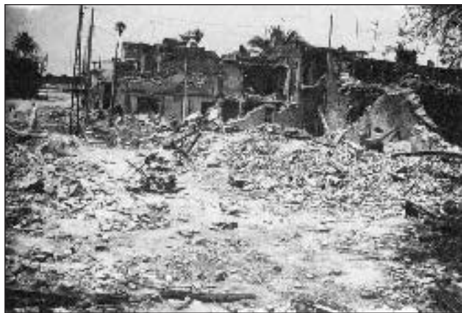
Basra (Irak) nach dem 2. Golfkrieg und dem Schiiten-Aufstand 1991